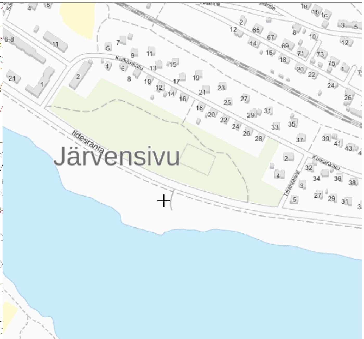
Maanmittauslaitos karttapaikka, Järvensivu Tampere